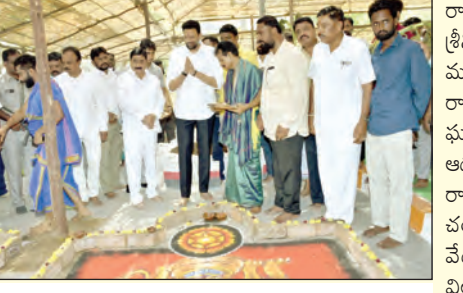
వారం రోజులుగా జరిగిన సీఎం జన్మదిన వేడుకల దృశ్యాలు