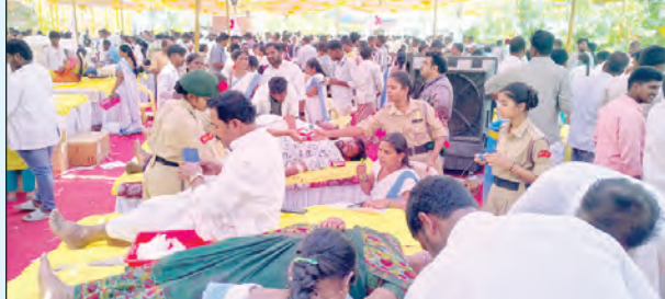
కళ్యాణదుర్గం ఎమ్మెల్యే సురేంద్రబాబు రక్తదానం చేస్తున్న దృశ్యం